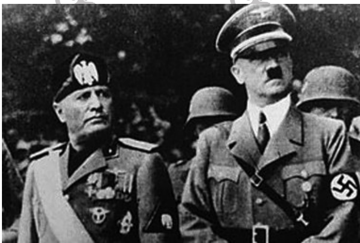
墨索里尼(左)，希特勒(右)